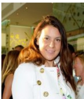
マリオン・バルトリ IC慈善活動アンバサダー

2013年度のウィンブルドン・シングルス・チャンピオンのマリオン・バルトリ氏がIC 慈善活動のアンバサダーに就任しました。『恵まれない子供達にやってあげられることは沢山あると思う。私は生涯テニスと共に生きてきて、そのテニスを習うことで勝つことの喜びや負けることの悔しさを味わい、ルールに従い自分をコントロールすることを学んだだけでそれらは生きて行くのに役立つこと・・・』と語っています。